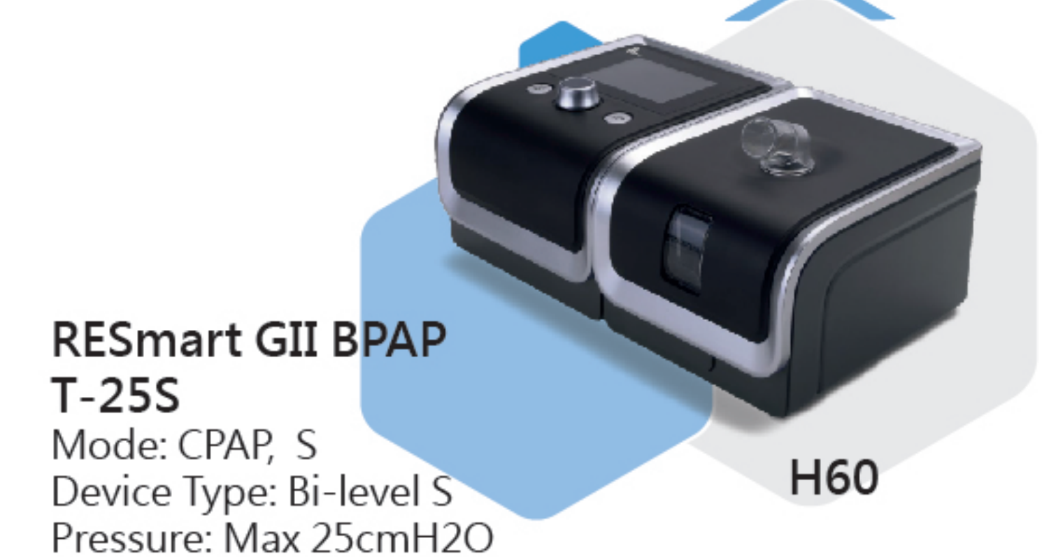
RESmart GII BPAP T-25S H60 Mode: CPAP, S Device Type: Bi-level S Pressure: Max 25cmH2O