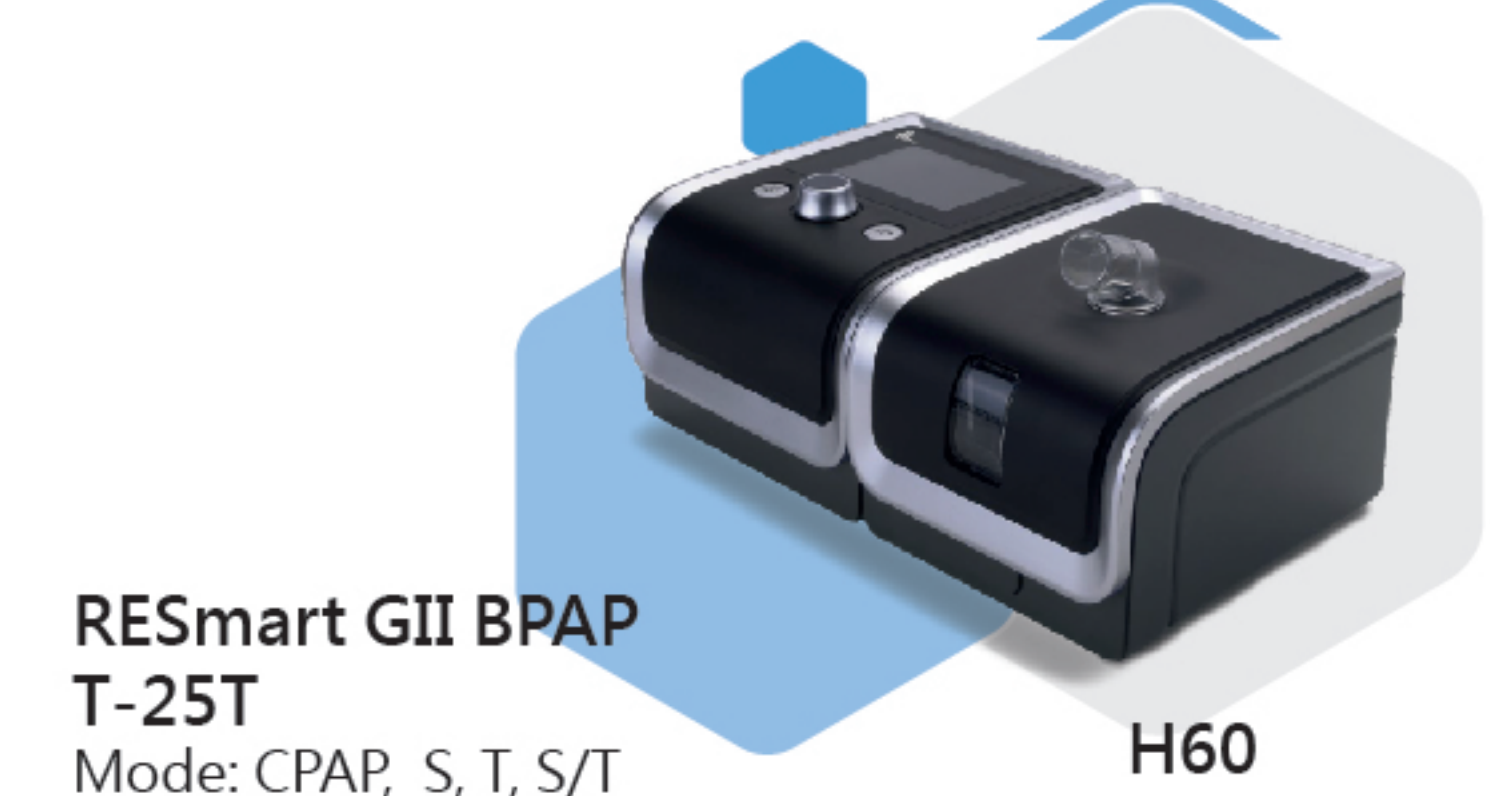
RESmart GII BPAP T-25T H60 Mode: CPAP, S, T, S/T Device Type: Bi-level S/T Pressure: Max 25cmH2O