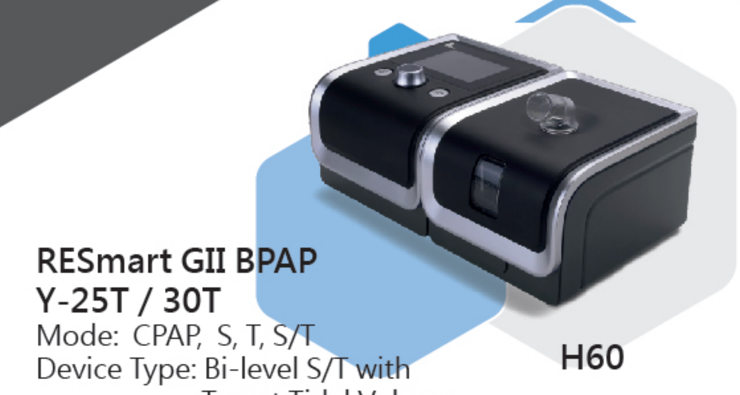
RESmart GII BPAP Y-25T / 30T H60 Mode: CPAP, S, T, S/T Device Type: Bi-level S/T with Target Tidal Volume Pressure: Max 25 / 30cmH2O