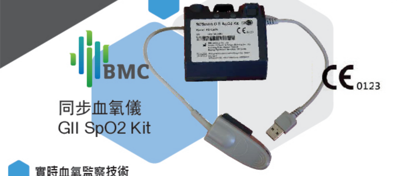
BMC 同步血氧儀 GII SpO2 Kit CE 0123 實時血氧監察技術 增加用者對用機之信心 令家人更了解用機情況 醫生可以更準確知道用機狀況