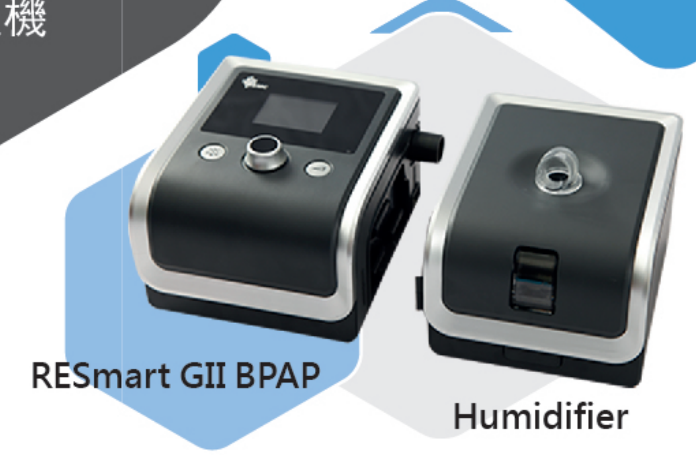
RESmart GII BPAP Humidifier