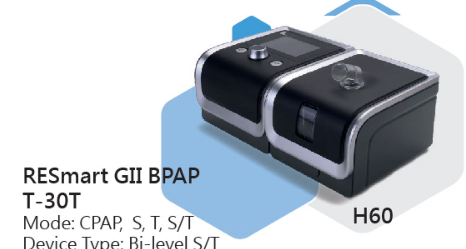
RESmart GII BPAP T-30T H60 Mode: CPAP, S, T, S/T Device Type: Bi-level S/T Pressure: Max 30cmH2O